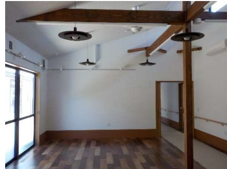
広がったLDK。 家具もまだ少なく広々です。

そんな「ケアホームふたば」、2棟目のお声は開設直後からいただいていたのですが、ノウハウも資金も何もかも足りない状況でしたので、「業態として続けていけること」を念頭に置いた計画を進めるのに、結果9年もの歳月がかかってしまいました。