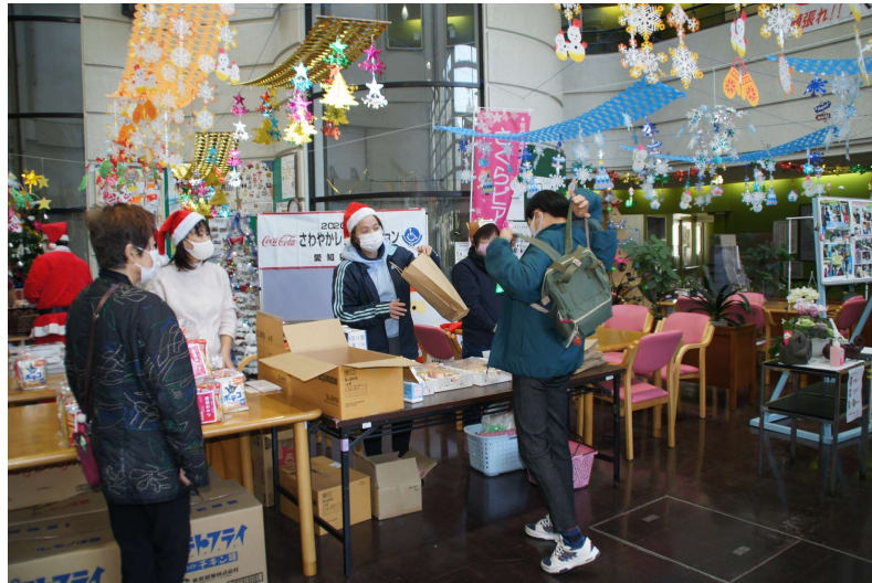
クリスマス会～さくらピア ロビーにて～