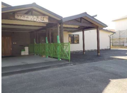
新しいホームの目印は 二つ並んだ入り口です。

当時は法人としての初めての事業形態で、だれも経験者のいない中で手探りで運営は大変でした。加えてグループホームやショートステイは職員が非常に集まりにくい事業形態ですので、せっかく利用のお話をいただくも期待に添えられない点多々あったかと思いますが、他には類を見ない「身体障がいを主障害とした事業」は反響も期待も大きく、豊橋市はもとより他市・他県の方にも利用していただけてきました。